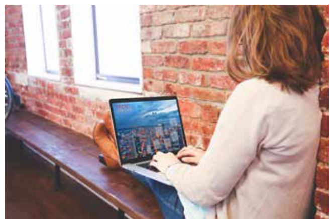
iNNOVO Cloud bietet „Homeoffice per Knopfdruck“.

Homeoffice-Arbeit soll die Verbreitung des Corona-Virus eindämmen. Doch dies kann nur mit effizienten und sicheren Lösungen funktionieren. Sind alle Mitarbeiter für die Homeoffice-Arbeit gerüstet? Gelangen diese an alle benötigten Unterlagen? Ist die Einhaltung der Datenschutz- und Compliance-Anforderungen gewährleistet? Auf diese und weitere Fragen ist das von iNNOVO Cloud entwickelte vOffice die Antwort. Dieser sichere, virtuelle Cloud-Arbeitsplatz spielt auch eine zentrale Rolle im